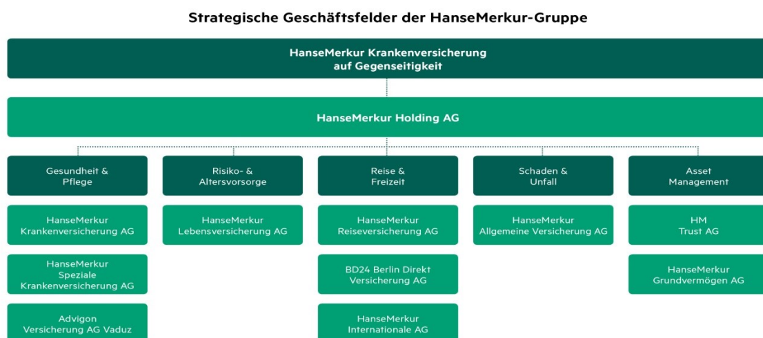
Abbildung 1: Wesentliche Gesellschaften der HanseMerkur Gruppe

Eine Übersicht bietet folgende Abbildung.